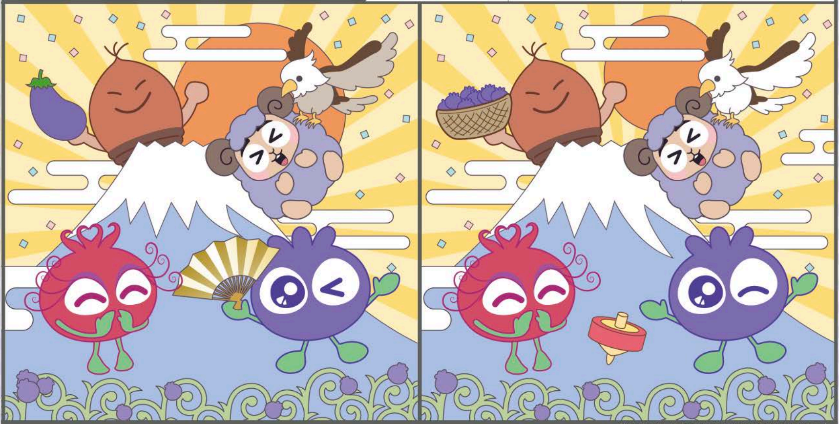
答えがわかったら応募してみよう！応募方法は裏面へ▶

★ Let's try it! ★ 顔を動かさず、目だけで左右のイラストの違いを見つけてみよう！