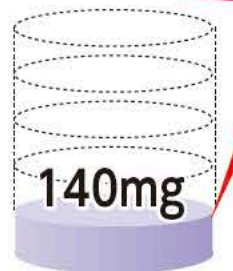
一般栽培種ブルーベリー