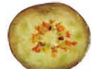
一般栽培種ブルーベリー

「よく見える」を支える青紫色の天然色素・アントシアニンはポリフェノール的一种。北欧のビルベリーには一般栽培種ブルーベリーの約5倍ものアントシアニンが含まれています。