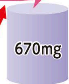
北欧の野生種ビルベリー

*一般栽培種ブルーベリーエキスと比較果実100gあたり換算(わかさ生活みらい研究所調べ)