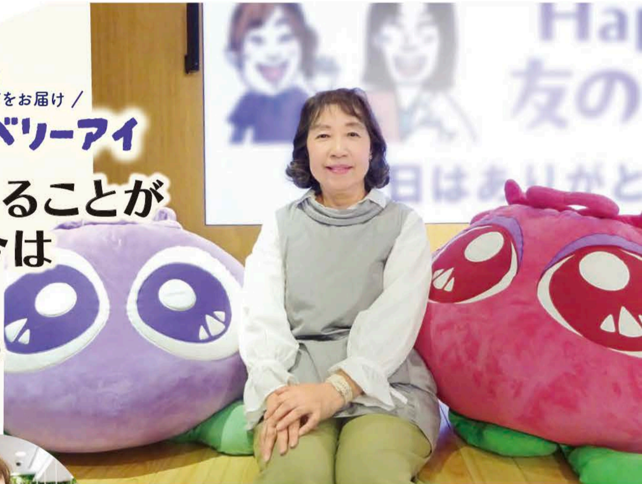
友の会にも参加。スタッフともイキイキと楽しそうに談笑されていました。

『ブルーベリーアイ』 『ブルーベリーアイ DELUXE』 ご愛飲歴 18年2ヵ月