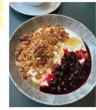
ベリーを使った朝食

ベリー類は大切な栄養源。夏にたくさん摘んで冷凍保存します。日本の梅干しみたいに、昔から「体にいいもの」として朝ごはんや体調を崩した時に食べられてきたんですよ。最近は「体にいい理由」がだんだんわかってきて、より関心が高まってきていると感じます。