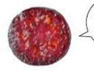
北欧の野生種ビルベリー