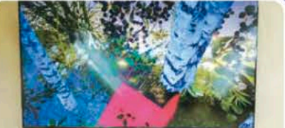
ビルベリー摘みパッチャル体験

WAKASA&CO. KYOTO3階では、ビルベリー摘みのパッチャル体験ができます。楽しみながら手摘みの大変さを体感してくださいね。