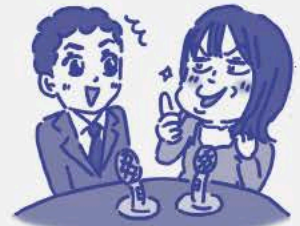
しゃちよ〜 シモムラニーナ