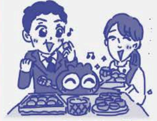
しゃちよ〜 ブルブルくん オグラアキ