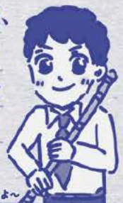
青年時代のしやちよん